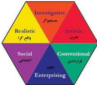
شکل ۳: مدل Holland Codes

این مدل بر اساس شش نوع شغلی استوار است که شامل Realistic، Artistic، Investigative، Social، Enterprising، و Conventional می‌شود (Toman و Voogt، ۲۰۱۹).