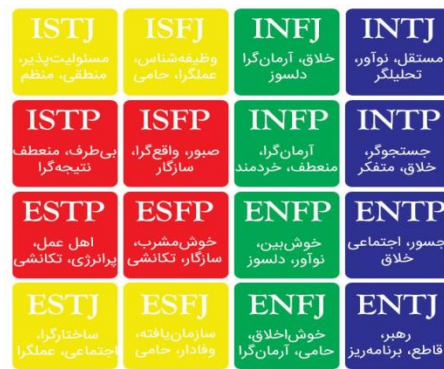
شکل ۱: مدل MBTI

این مدل بر اساس چهار بُعد شخصیتی استوار است که شامل تیپ‌های Extroversion (E) یا Introversion (I)، Sensing، Thinking (T) یا Feeling (F)، Intuition (N) یا Sensing (S)، و Judging (J) یا Perceiving (P) می‌شود (Toman و Voogt، ۲۰۱۸).