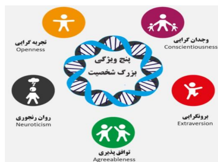
شکل ۲: مدل Big Five Personality Traits

این مدل شامل پنج عامل اصلی شخصیتی است که عبارتند از: Openness to Experience، Conscientiousness، Extraversion، Agreeableness، و Neuroticism.